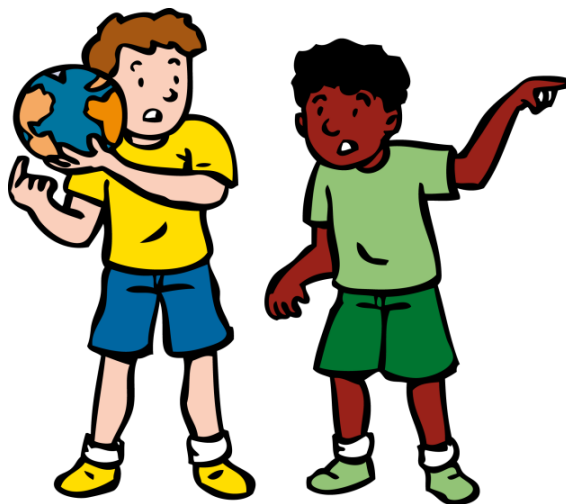
We lossen conflicten zelf op