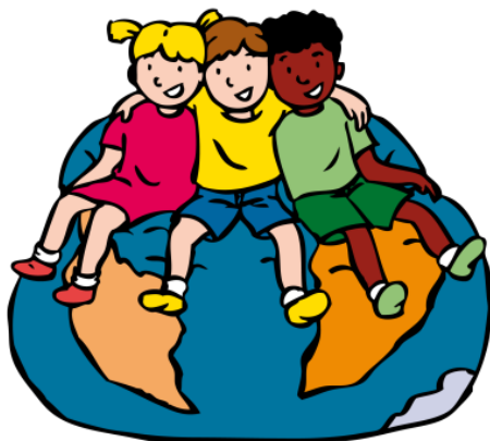
We horen bij elkaar